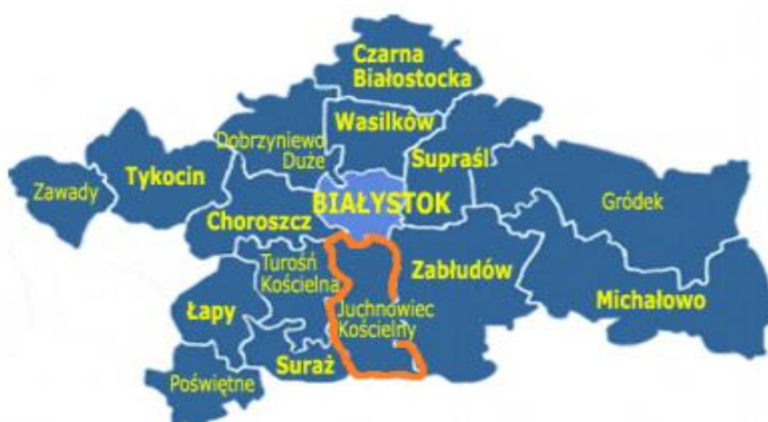
Rysunek 1. Położenie Gminy Juchnowiec Kościelny.

Gmina Juchnowiec Kościelny położona jest w południowej części powiatu białostockiego na terenie województwa podlaskiego. Ponadto gmina wraz z 10 innymi tworzy aglomerację białostocką (Miasto Białystok, gmina: Łapy, Suraż, Juchnowiec Kościelny, Turośń Kościelna, Choroszcz, Dobrzyniewo Kościelne, Wasilków, Czarna Białostocka, Supraśl i Zabłudów). Gmina graniczy od wschodu z gminą Zabłudów (powiat białostocki), od północy z gminą Choroszcz i Miastem Białystok (powiat białostocki) od zachodu z gminą Turośń Kościelna i Suraż (powiat białostocki) od południa z gminą Bielsk Podlaski (powiat bielski).